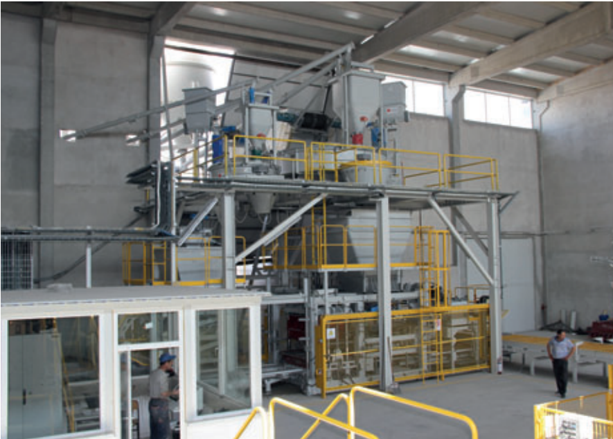
Sistemin kalbi: Poyatos üretimi mikser ve beton blok makinesi

Benzer şekilde makinenin gerektirdiği bakım işleri olduğunda kolay bir şekilde gerçekleştirilebilmektedir. Makineyi kullanmak için uzman bir personele gerek yoktur ve mekanik bilgilere sahip olmayan bir operatör de tüm bu işleri kendi başına yapabilir.