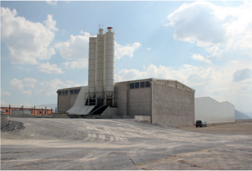
Toplam 3 x 120 tonluk silo kapasitesi ile tesis çok büyük miktarlarda hammadde depolayabilmektedir

Beton blok, bims ve parke taşı üretiminde kullanılan tamamen otomatik Poyatos tesisi Çevik Yapı-İzombis firmasının Kayseri'deki yeni tesislerinde 2012 temmuz ayında kuruldu ve işletmeye başlandı. Üretimde büyük hassasiyet gösteren Poyatos makinelerinin yapısı nümerik kontrollü makineler aracılığıyla sağlanır, bu da tesisin tüm makinelerinde dayanıklılığın ve gücün artmasına yol açar. Ayrıca Poyatos tüm dünyadaki yerel tedarikçilerde kolaylıkla bulunabilecek parçaları kullanmaktadır, ve bu sayede Poyatos müşterileri yedek parça sorunu yaşamamaktadırlar, bunun yanı sıra Poyatos'un daimi stokları bulunmakta ve müşterilerine yirmi dört saat boyunca hizmet verebilmektedir. Bu sayede İspanya ve Türkiye arasında büyük bir mesafe olmasına rağmen, Çevik Yapı-İzombis yönetimi, Poyatos makinesinin kendisi için en uygun olduğu kanısına varmıştır.