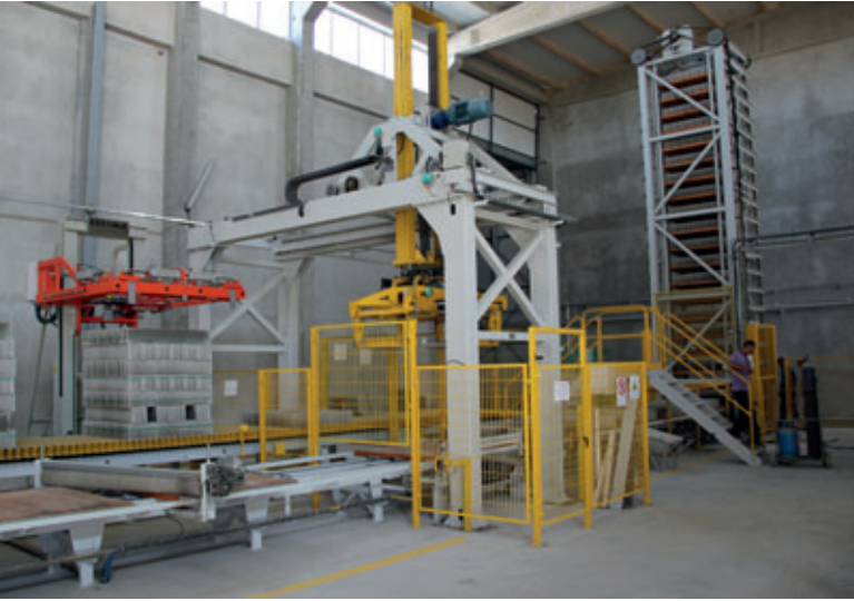
Bantlama ünitesine sahip paletleme istasyonu

harç arabası motorlu hareket eden bir ızgarayla donatılmıştır ve bu sayede homojen bir dolum sağlanabilmektedir ve ayrıca dolgu ve vibrasyon zamanı belirgin ölçüde kısalmaktadır.